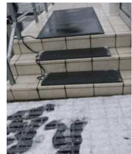
<ヒートマットの設置例>

余裕をもって、急がず、短い歩幅で歩く ～あせらない 急ぐ時ほど落ち着いて～ 足のサイズにあった滑りにくい靴の着用 水・油用の耐滑靴も、雪や氷の上では滑ることがあります 凍結防止剤の散布、除雪・融雪の徹底 除雪・融雪するためのマットの敷設 など